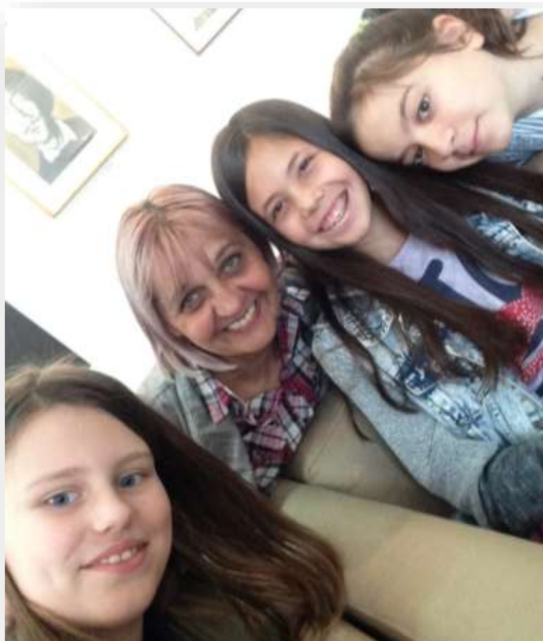
Насмејане учеснице радионице